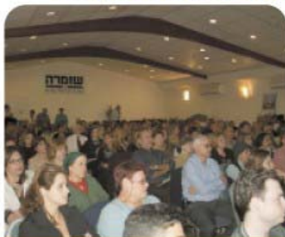
מעל 200 פקידות סוכנים ומנהלות תיקים השתתפו ביום העיון בכפר המכבייה.