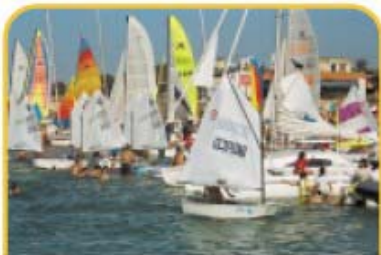
נציגי "שומרה" במסגרת על שם סא"ל יוסי קורקין שהתקיים במכמורת לפני כחודש